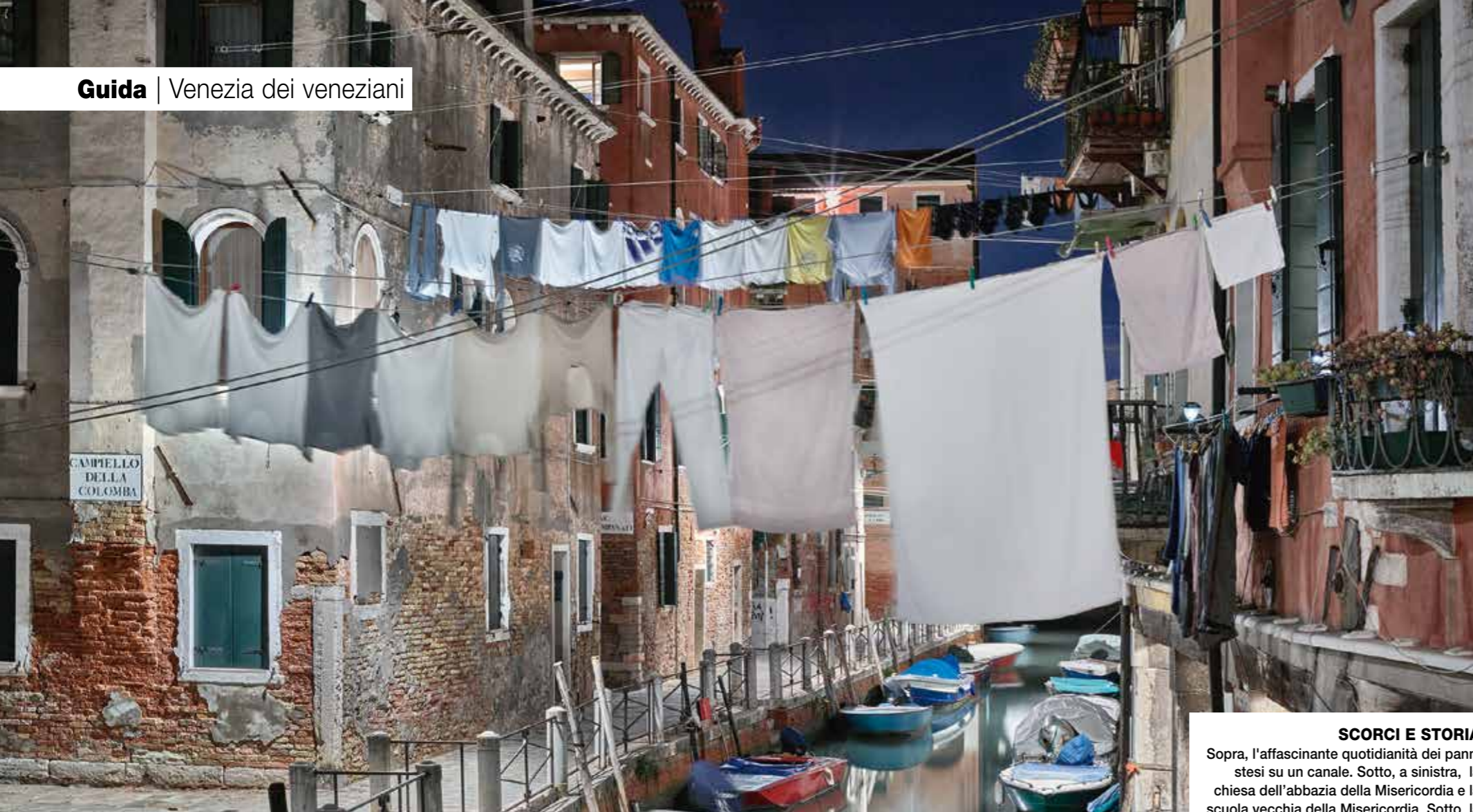
SCORCI E STORIA Sopra, l'affascinante quotidianità dei panni stesi su un canale. Sotto, a sinistra, la chiesa dell'abbazia della Misericordia e la scuola vecchia della Misericordia. Sotto, la "bocca della delazione" di Palazzo Ducale, antica sede del Doge e delle magistrature veneziane, in cui i cittadini lasciavano lettere di denuncia anonime ai danni degli evasori delle imposte.